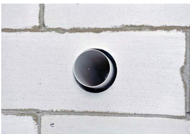
Iestatīt montējamo elementu atbilstošā pozīcijā.

Ceresit CX 1. Ūdens tvertņu iekšējo virsmu blīvēšanai ieteicams izmantot ūdensnecaurlaidīgu javu CR 65 vai CR 166.