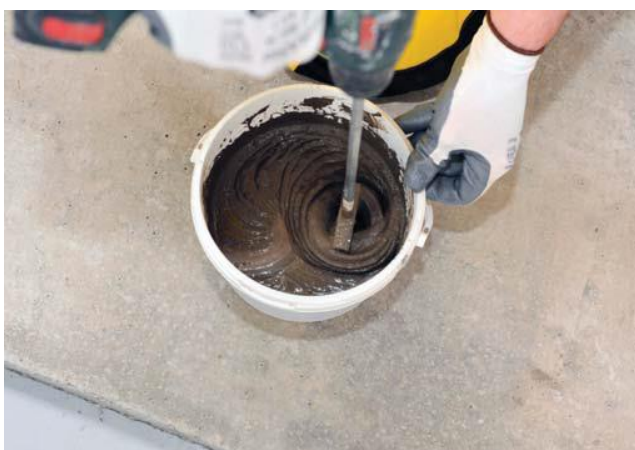
Samaisiet, līdz iegūta viendabīga masa bez kunkuliem.