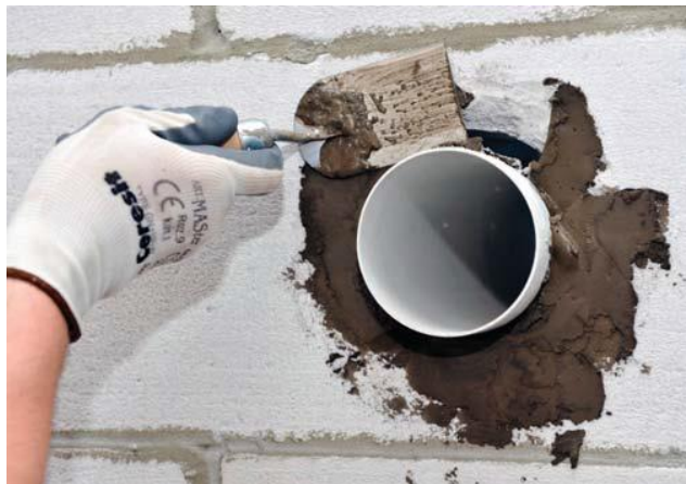
Montāža ar javu CX 5.