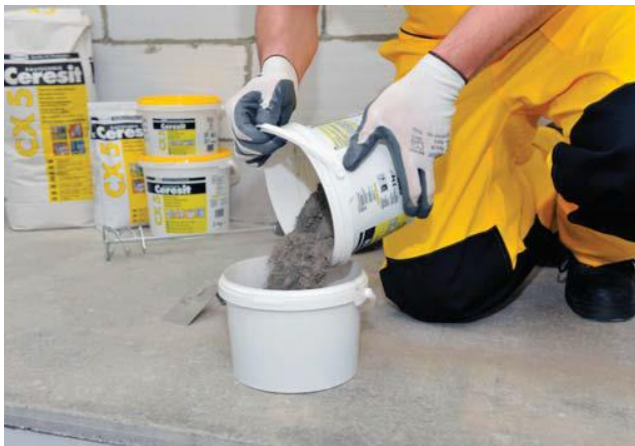
Ieberiet materiālu ūdenī.